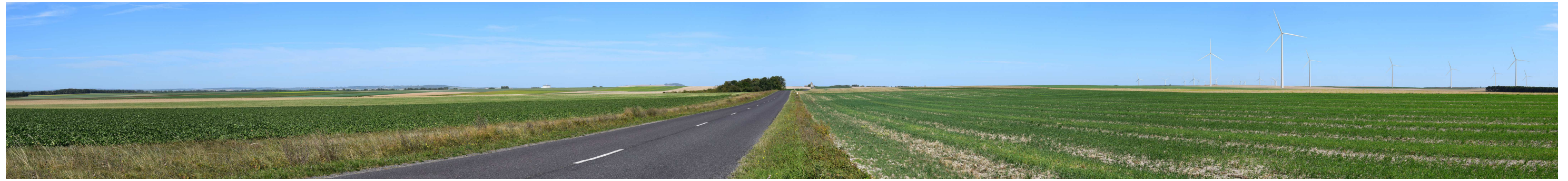
Le site actuel