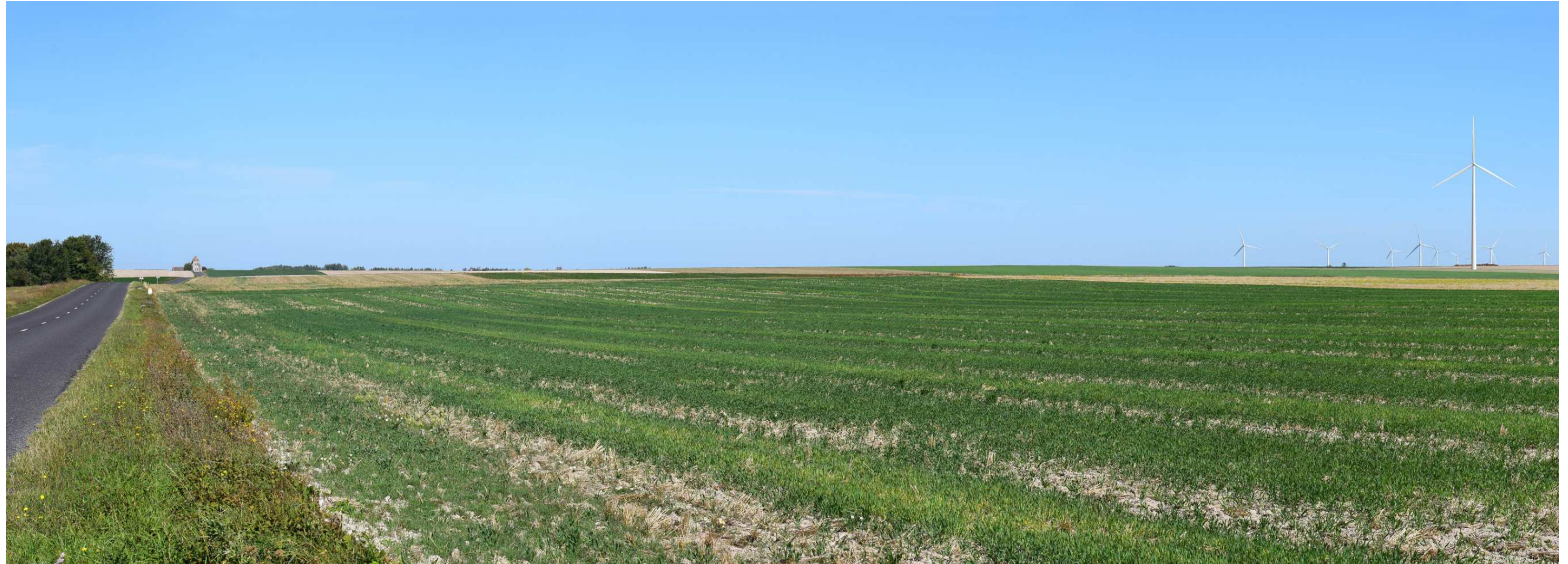
Le site actuel